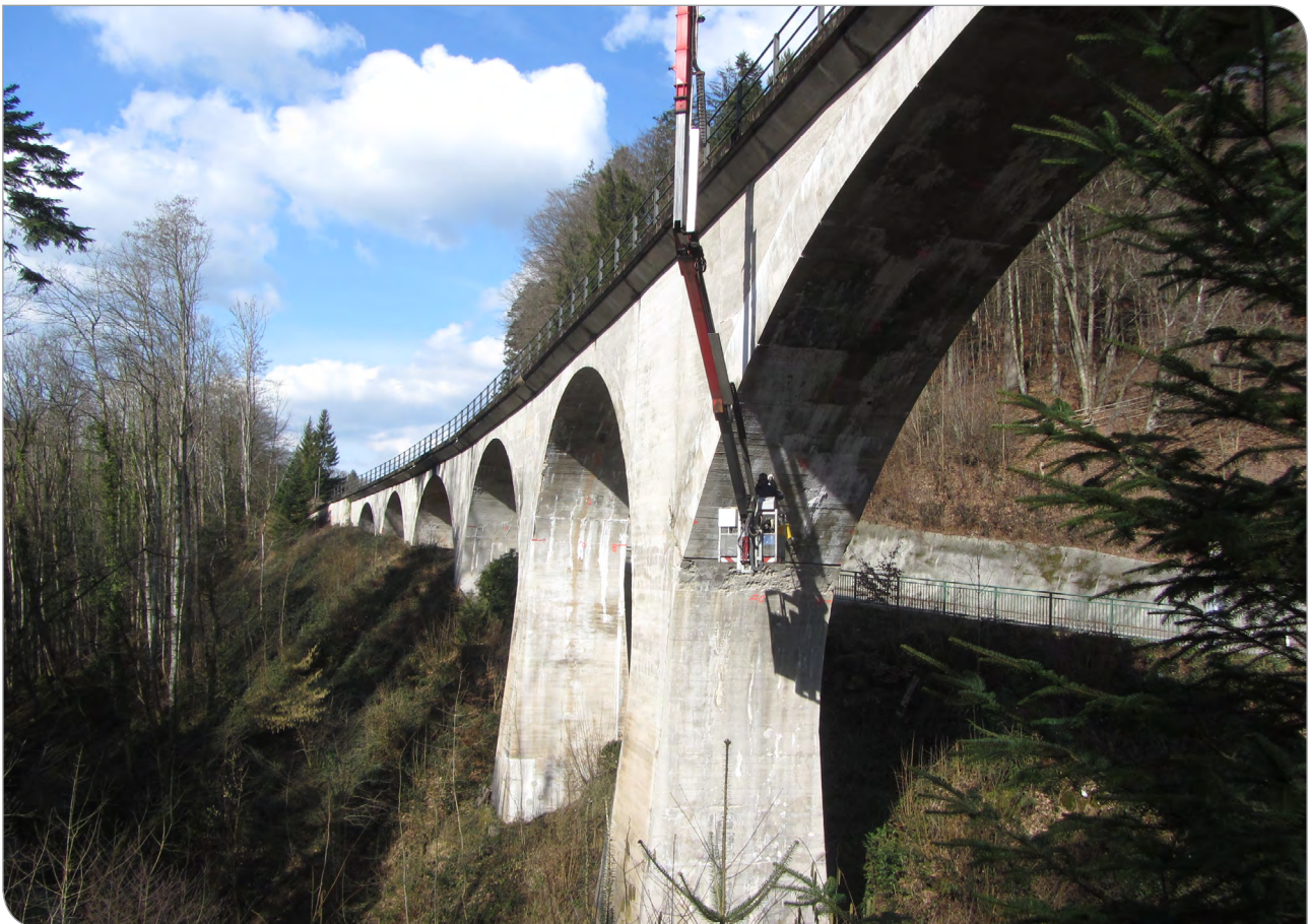
Durchführung von Zustandsaufnahmen per Radar und Ultraschall von einer mobilen Arbeitsbühne aus.