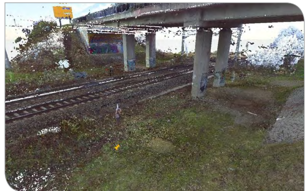
3D-Modell eines Infrastrukturbauwerks

Die Digitalisierung bietet vielfältige Möglichkeiten, bestehende Prozesse zu optimieren sowie ganz neue Wege zu gehen. Dabei geht es nicht nur um Kosteneinsparungen, sondern auch um höhere Flexibilität und Zeitersparnisse.