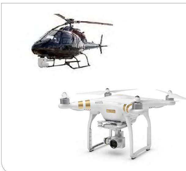
Helikopter mit 3D-Laserscanner und Drohne mit Kamera

Im Bereich Digitale Fabrik oder Building Information Modeling (BIM) ist die Bestandserfassung und Modellierung eine Schlüsseltechnologie zu neuen virtuellen Welten. Das Exponat zeigt die 3D-Digitalisierung eines Bauprojektes mittels Laserscanner und Drohne sowie die Modellierung der Daten. Dabei liegt der Forschungsschwerpunkt auf der Datenbereitstellung von universellen 3D-Daten sowie der automatisierten Modellrückführung aus Messdaten.